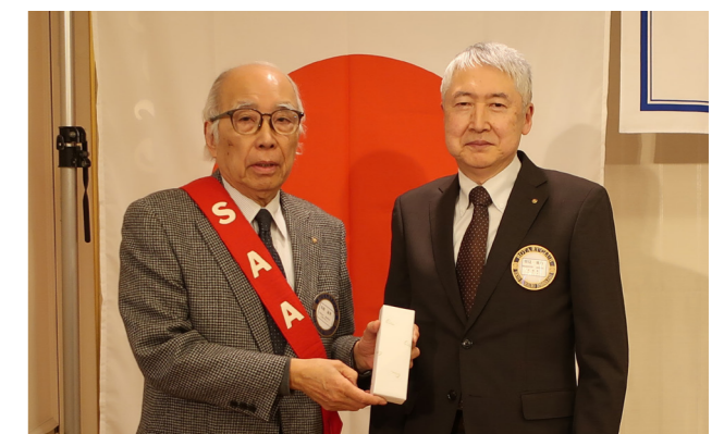
2月お誕生日 長尾会員