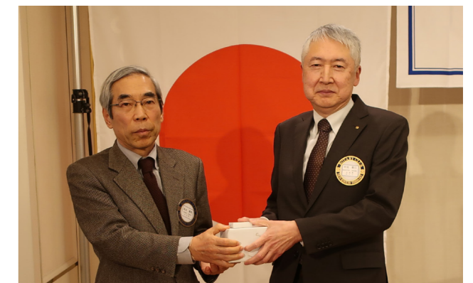
皆出席 4年 里見会員